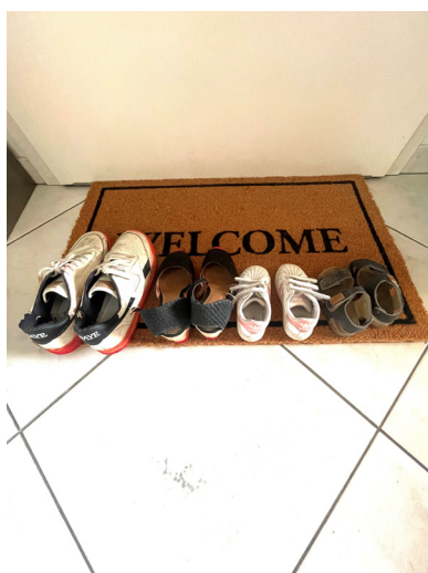
artwork - Sarah Mandres.jpg

Cette œuvre est ma tentative d'attirer l'attention sur ce qui passe souvent inaperçu, non seulement comme expression artistique, mais aussi comme contribution au débat social plus large sur la violence familiale. C'est ma façon de sensibiliser, de susciter l'émotion et peut-être même d'inciter à la réflexion ou à l'action.